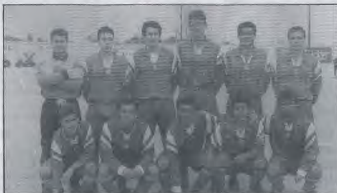
Formación del Alcalá que el domingo arrancó un punto en el campo del Consolación.

El conjunto alcalaense no causó una brillante impresión, pero tampoco muy mala. Hizo lo que pudo en un campo de tierra y ante un equipo tosco, duro y difícil en su terreno,